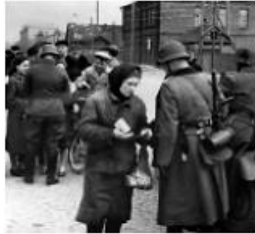
Оккупация Беларуси немецко-фашистскими захватчиками (1941–