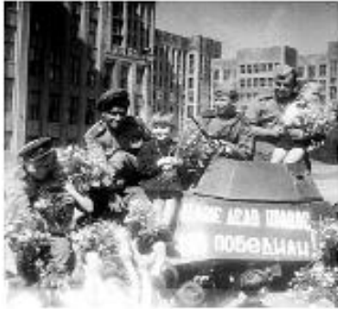
Освобождение Беларуси от немецко- фашистских